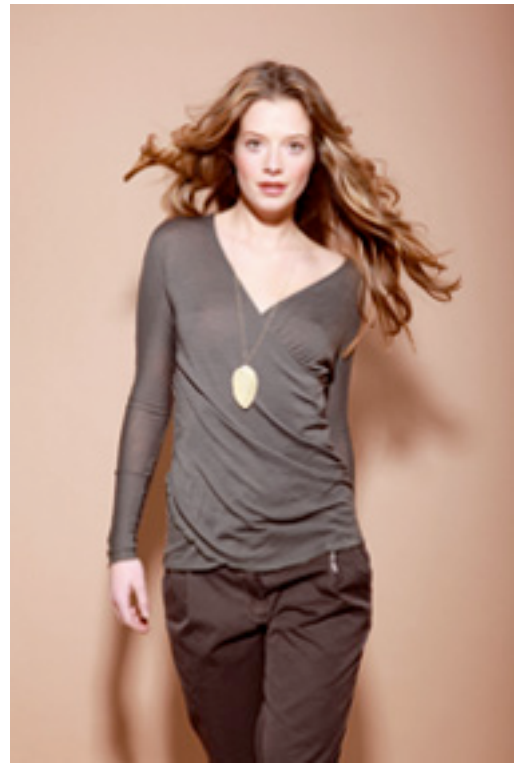
Deilig ull "omslagsgenser" i blå. Kr 870,-