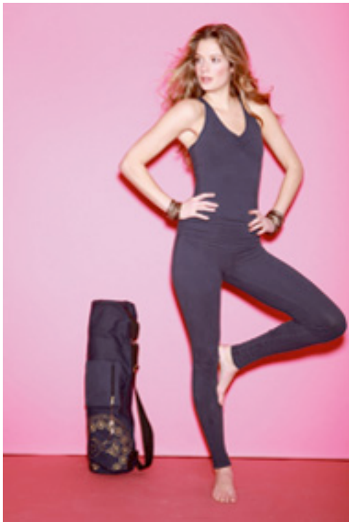
Nydelig hel dress "eclipse blue" som på bildet kr 765,-. Kun i str. S Yogamattebag, finnes i beige kr 680,-