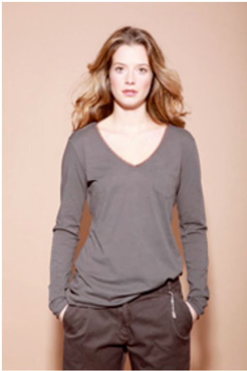
Nydelig økologisk v-genser i grå/blå kr 620,-