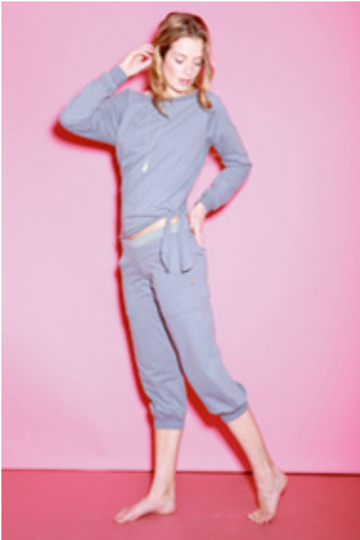
Deilig genser i "nickel" som på bildet kr 530,-