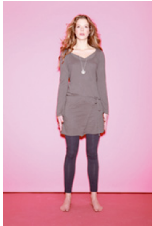
Tunika i myk bomull, finnes i grå/blå og sand kr 760,- Supermyke leggings i "eclipse blue" og sort kr 375,-