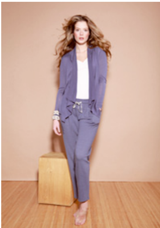
Deilig ulljakke i nydelig blåfarge som vist på bildet. Kan knytes foran. Kr 850,-