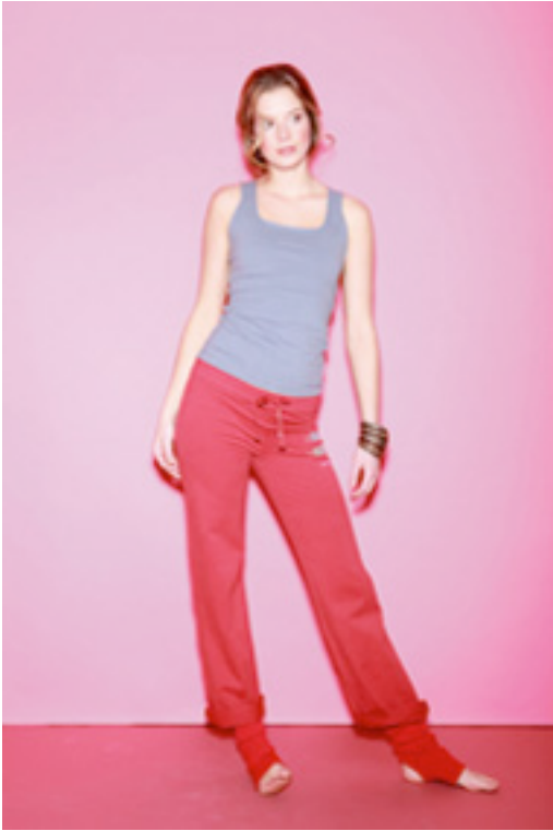
Yogatopp finnes i "nickel" som på bildet kr